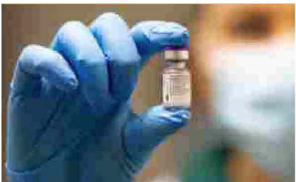
Posted by admin2012 - Gennaio 5, 2021 Al via vaccinazioni in casa riposo. La prima è una 98enne

Nel 2021 la Fondazione de Claricini Dornpacher compie 50 anni di attività, trascorsi con la missione "custodire e produrre cultura": gli eventi per celebrare questo anniversario coincideranno con il progetto dedicato ai 700 anni dalla morte di Dante Alighieri. A settembre 2021 la Fondazione promuoverà una mostra di codici presenti in Friuli tra i quali un codice dantesco originale friulano risalente al 1466