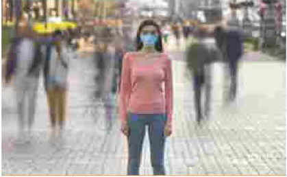
Posted by admin2012 - Gennaio 5, 2021 Nuove misure in atto fino al 15 gennaio 2021

Nel 2021 la Fondazione de Claricini Dornpacher compie 50 anni di attività, trascorsi con la missione "custodire e produrre cultura": gli eventi per celebrare questo anniversario coincideranno con il progetto dedicato ai 700 anni dalla morte di Dante Alighieri. A settembre 2021 la Fondazione promuoverà una mostra di codici presenti in Friuli tra i quali un codice dantesco originale friulano risalente al 1466