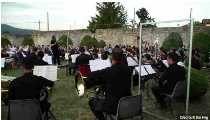
Un momento del concerto

Nel giardino di Villa de Claricini Dornpacher il primo concerto della serie Dante in musica, con l'Orchestra di Fiati del Conservatorio Tomadini