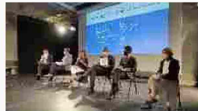
Trieste Next/10, la presentazione del festival